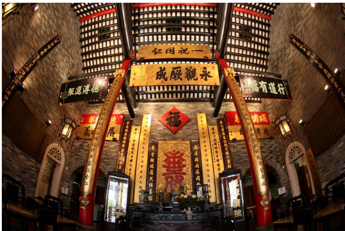
文物館內展示具歷史價值的匾額和對聯