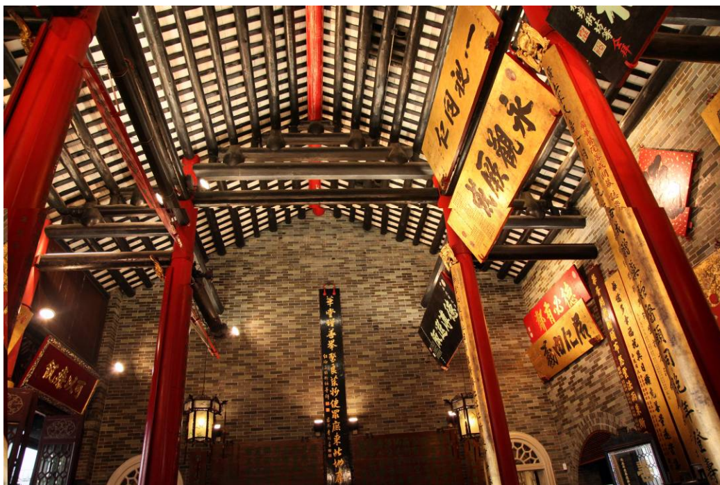
大堂內的中式桁架結構