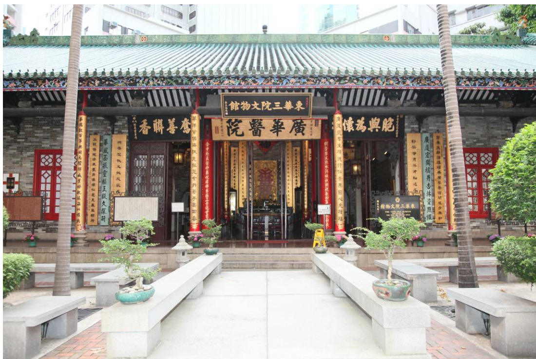
東華三院文物館正面