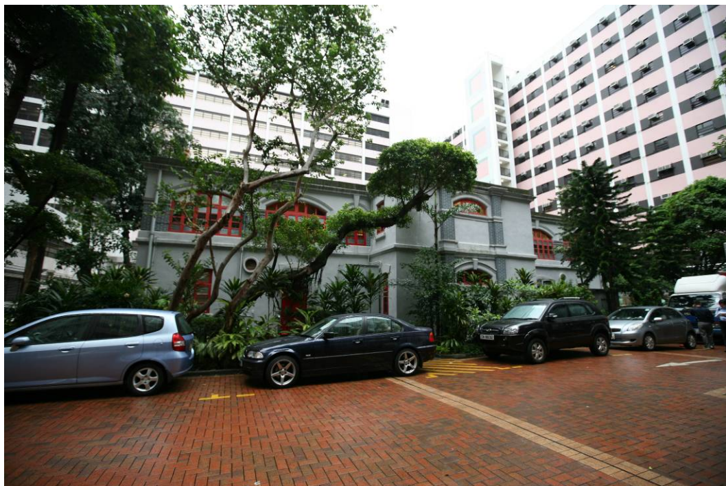
建築物背面的西式窗戶和牆身裝飾