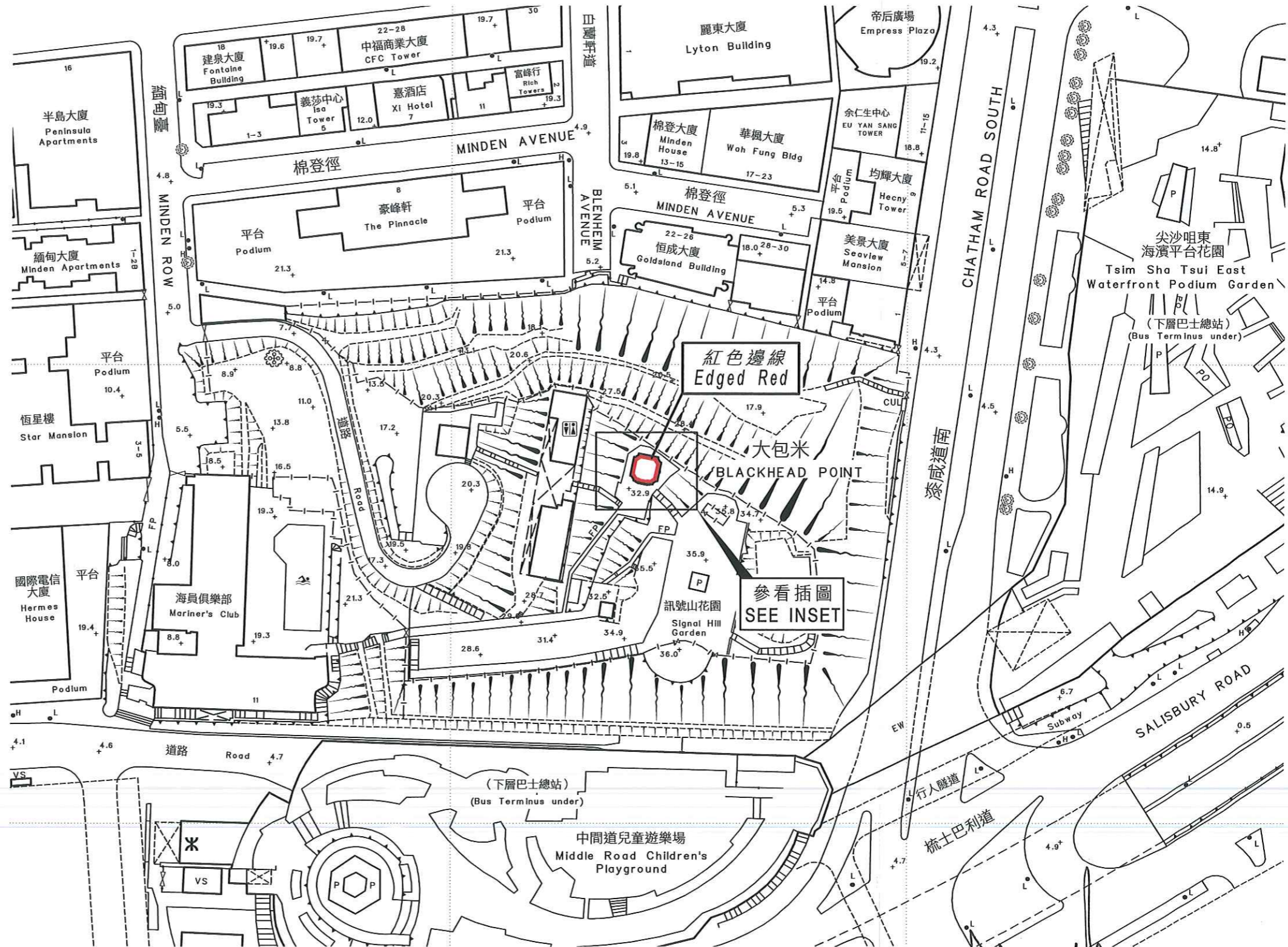
以紅色邊線標示的面積約為 36 平方米 EDGED RED AREA 36 SQUARE METRES (ABOUT)