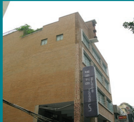
已被修復原貌及活化再利用的聯合書局