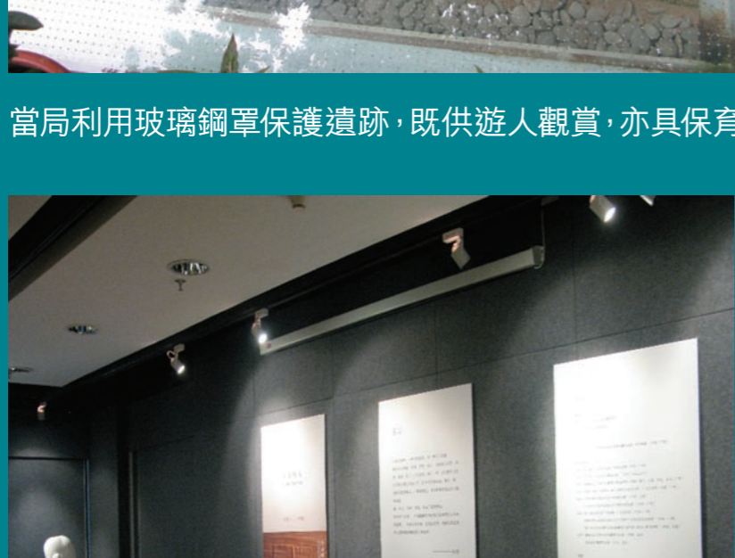
書店五樓設展覽廳供藝術家展示作品