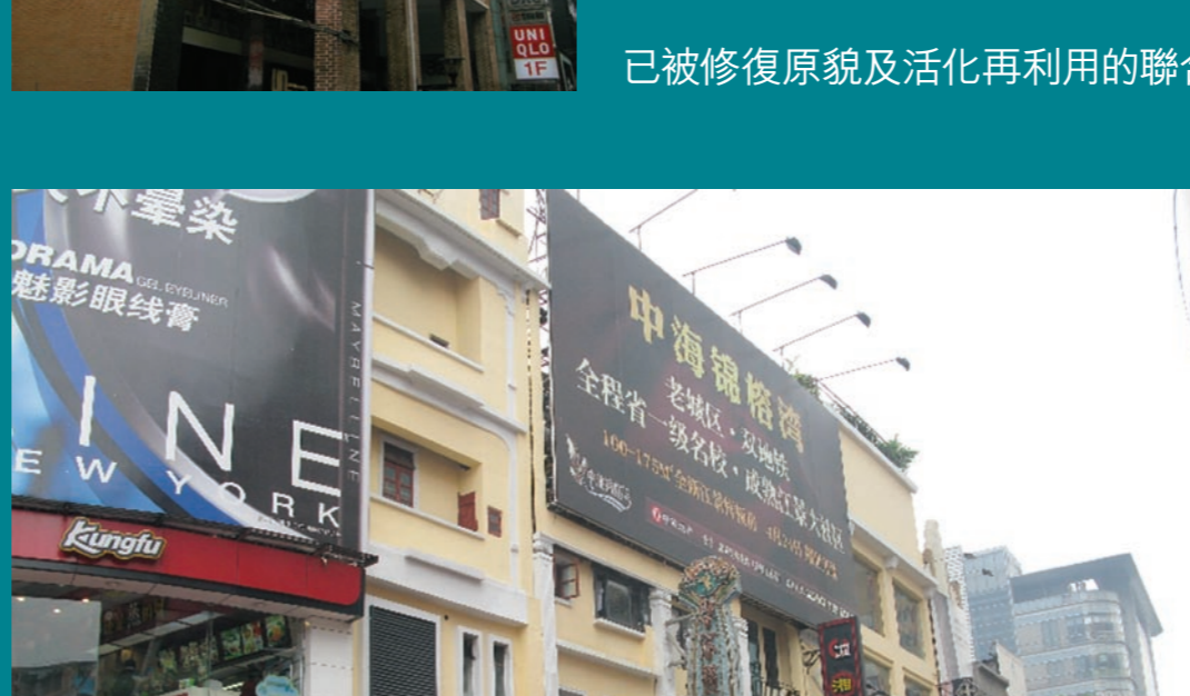
千年古道遺址旁的北京路已成為重要的遊客觀光及購物點