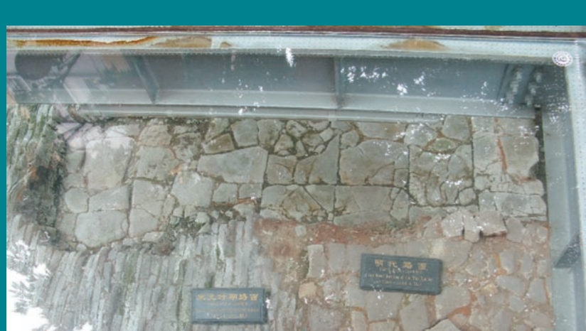
當局利用玻璃鋼罩保護遺跡，既供遊人觀賞，亦具保育作用