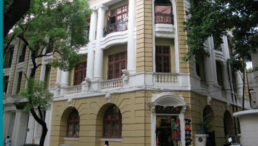
充滿歐陸風情的沙面島建築群