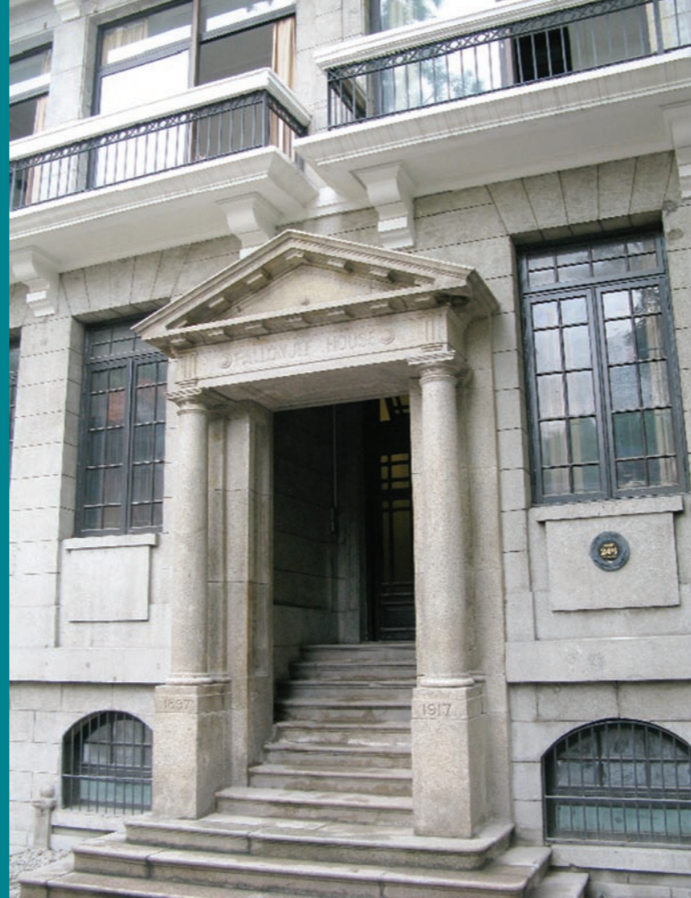
伯郎茲屋門樓花崗石橫額雕刻“PALLONJEE HOUSE”