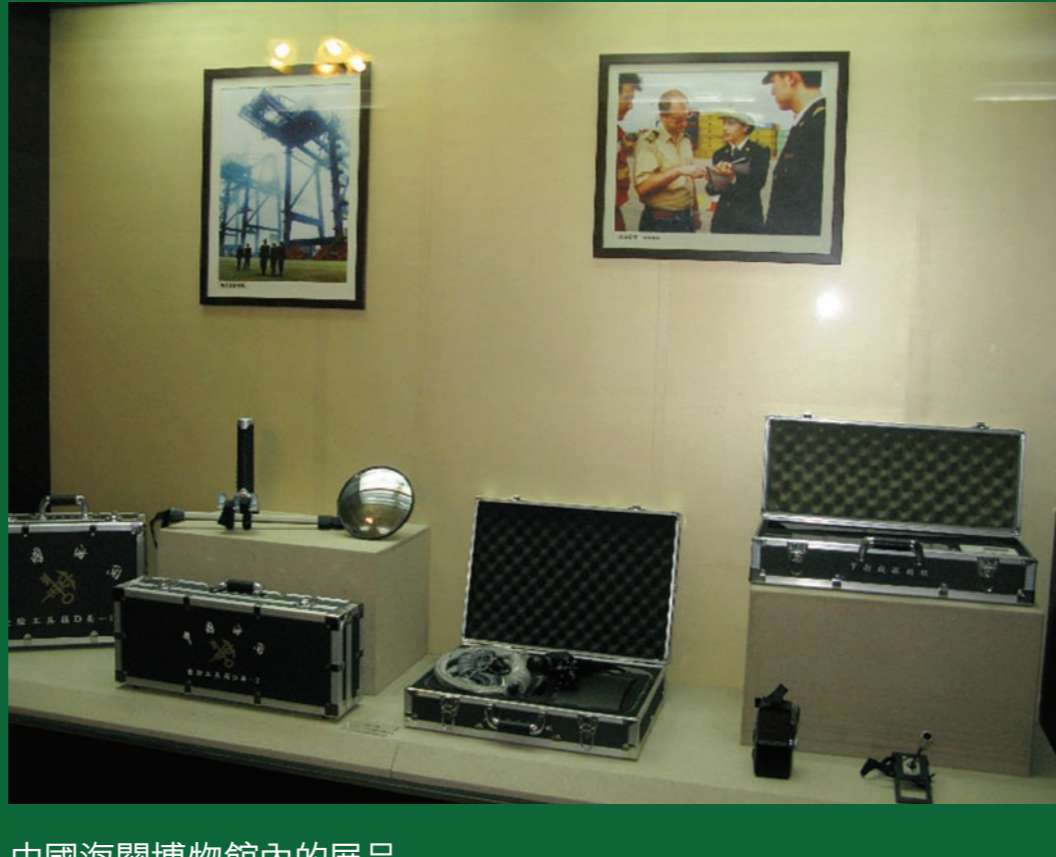
中國海關博物館內的展品